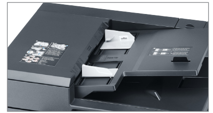
Tempo prima copia molto rapido: 5,7 sec.