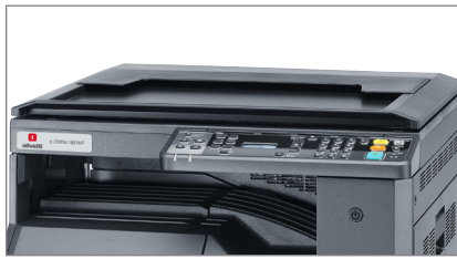
Scanner a colori via twain